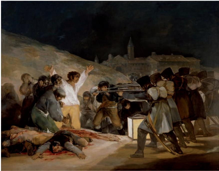
Els afusellaments o El 3 de maig a Madrid , de Francisco de Goya