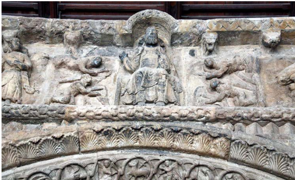
Portalada del monestir de Santa Maria de Ripoll

a) Dateu l'obra i situeu-la en el context històric i cultural corresponent.