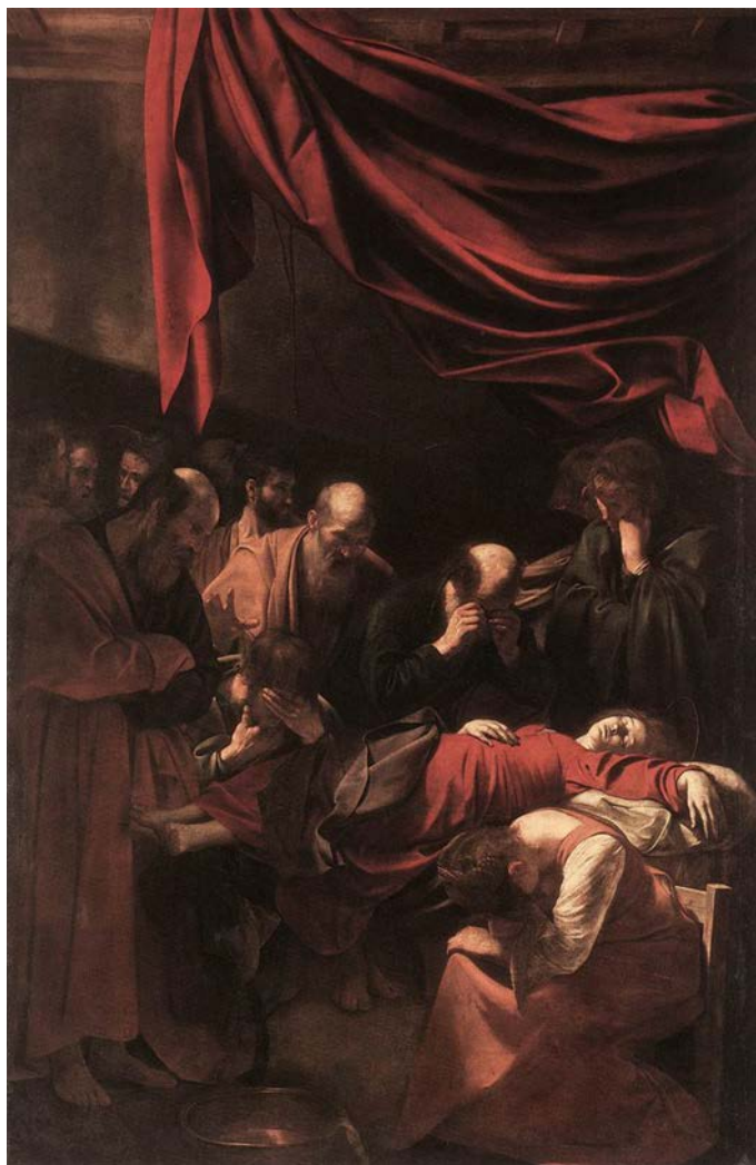
La mort de la Mare de Déu, de Caravaggio

a) Dateu l'obra i situeu-la en el context històric i cultural corresponent.