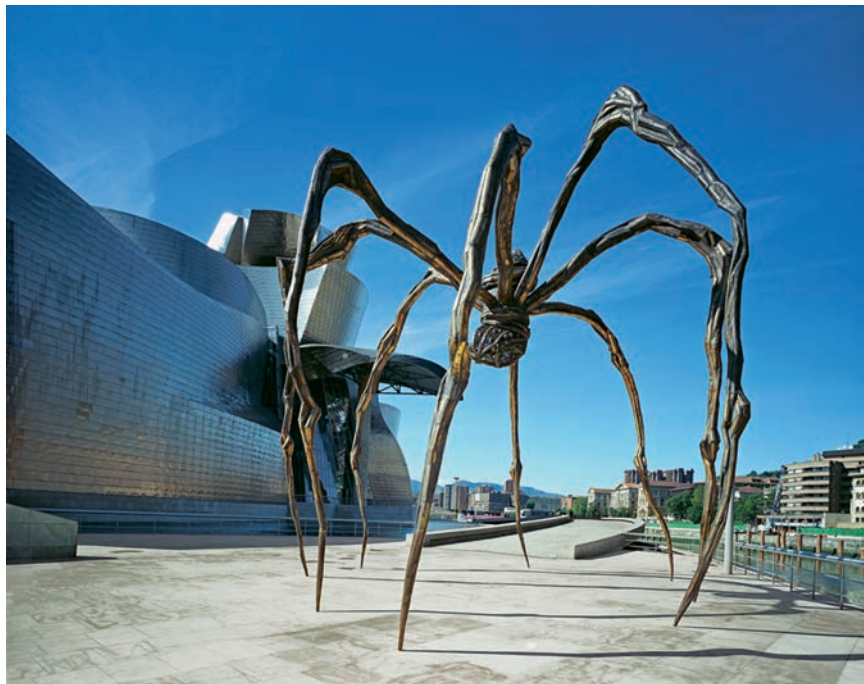
Maman , de Louise Bourgeois