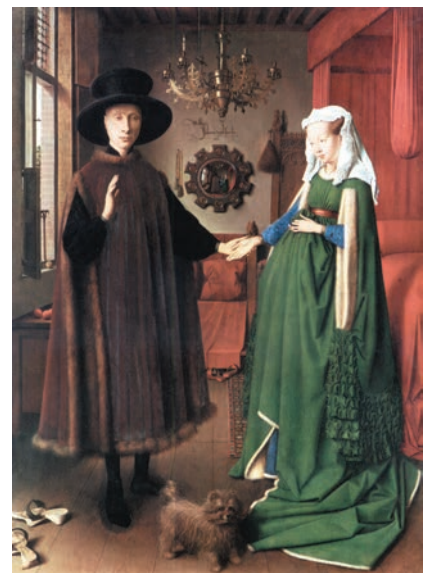
El matrimoni Arnolfini, de Jan van Eyck