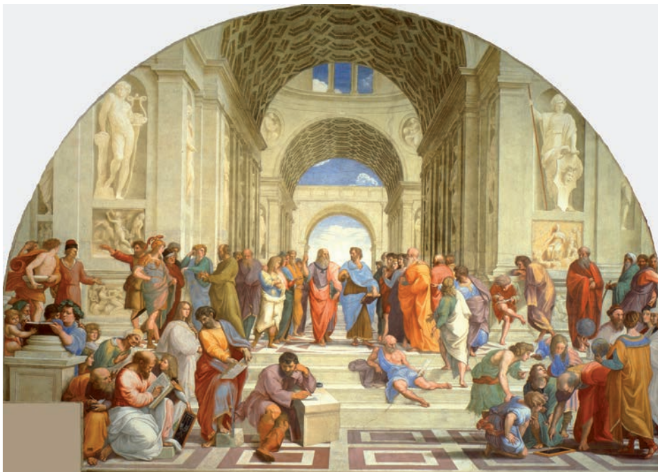
L'escola d'Atenes, de Rafael